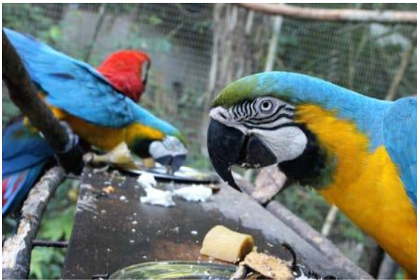
Guacamayos en el aviario

Para garantizar y reservar tu plaza aquí te pedimos por un depósito no reembolsable de la primera semana de pago (350 soles). Esto se puede pagar a través del banco con una transferencia. Por favor, envíe un correo electrónico para preguntar por más detalles.