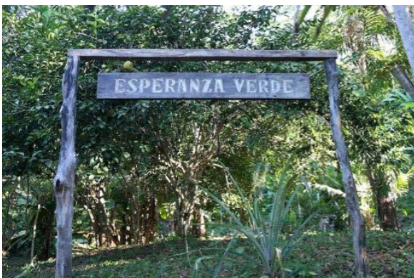
Letrero 'Esperanza Verde'

Necesitará ropa de trabajo holgada (no de tela gruesa) y cómoda. No gastes mucho dinero en ropa especial tipo safari, ya que lo más probable es que tire toda su ropa de trabajo cuando termine de ser voluntario en Esperanza Verde (se mancharán y rasgarán). Es preferible llevar pantalones largos mientras trabaja, para protegerse de las picaduras de insectos. Además, necesitas botas de goma ya que suele haber mucho lodo. Puedes traer tus propias botas de casa o comprar botas en Pucallpa por unos 20 soles. Hay algunas botas que dejaron viejos voluntarios, pero las tallas populares, especialmente los tamaños grandes a menudo se agotan. También necesitará algún tipo de poncho de lluvia , pero nuevamente no te recomiendo que traigas nada