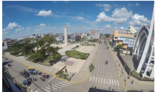
La Plaza de Armas en Pucallpa

Esperanza Verde se encuentra al norte de la amazonia peruana, en la región Ucayali. Desde Lima se puede viajar en bus o avión . La siguiente información le brindara todas las opciones de transporte. Las descripciones pueden parecer un poco complicadas, sin embargo, la mayoría de los voluntarios han encontrado el viaje fácil y no han experimentado ningún problema grave.