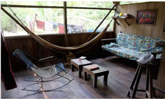
Sala en la casa de voluntarios

Mientras camina por el bosque, puede encontrar algunos mosquitos, difícilmente hay alguno cerca de la casa (solo en febrero a mediados de marzo hay más). Durante el día hay moscas chiquitas que también muerden, pero estos nuevamente se encuentran principalmente por el río principal, lejos de la casa.