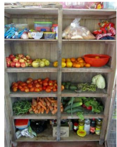
Estante de víveres

Salimos a comprar la comida una o dos veces por semana al pueblo de Curimana (a 1 hora de distancia). La comida es muy básica e incluye elementos como pasta, arroz, lentejas, frijoles, huevos, harina, leche en polvo y verduras y frutas frescas (dependiendo de la temporada). Especies diferentes del ajo, sal, pimienta y orégano son difíciles de obtener, por lo que es posible que desee traer algunas de sus especias favoritas de casa (por ejemplo, curry, tomillo, eneldo, romero, etc.). De lunes a viernes el almuerzo es preparado por nuestro cocinero. Los voluntarios preparan, en turno, el resto de las comidas durante la semana.