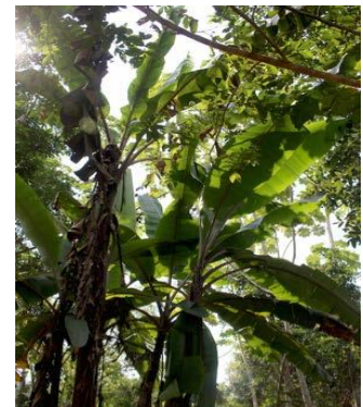
La Selva Tropical

En Lima y Pucallpa (como en cualquier gran ciudad) es importante mantener sus pertenencias cerca a usted, no las deje en ningún lado, y siempre tenga cuidado por la noche. Como extranjero eres un objetivo fácil para los raqueteros o ladrones de paso.