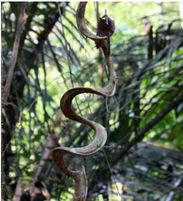
La Selva Tropical