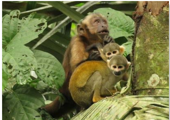
Mica (Capuchin), Louie and Leo (Squirrel Monkeys)