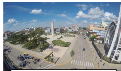
Plaza de Armas, Pucallpa

Al viajar en autobús hay dos opciones. Puede viajar de Lima a Neshuya (17 horas) o Lima a Pucallpa (18 horas), de ahí en adelante vía Curimana . Para Neshuya subes al autobús con destino a Pucallpa, pero simplemente se baja antes del bus en Neshuya. Consultes a continuación para obtener más detalles.