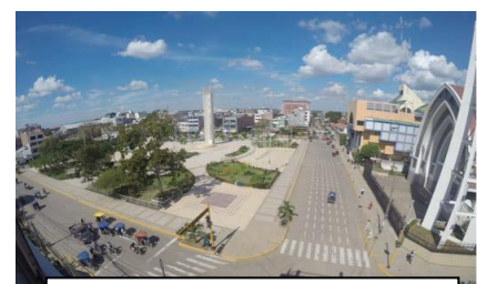
Plaza de Armas, Pucallpa

Al viajar en autobús hay dos opciones. Puede viajar de Lima a Neshuya (17 horas) o Lima a Pucallpa (18-22 horas), de ahí en adelante vía Curimana . Para Neshuya subes al autobús con destino a Pucallpa, pero simplemente se baja antes del bus en Neshuya. Consultes a continuación para obtener más detalles.